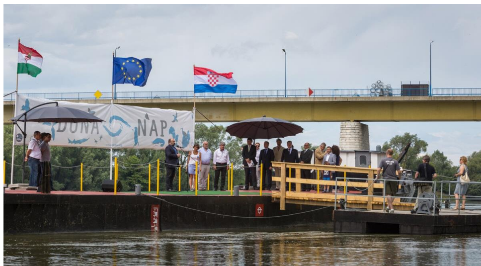
Ünnepi megnyitó a Dráván

Az Országos Vízügyi Főigazgatóság (OVF) a 2017. évi Nemzetközi Duna Napot Barcson tartotta, a Dél-dunántúli Vízügyi Igazgatósággal közös szervezésben. A magyarországi esemény a Duna egyik mellékfolyójának, a Dráva partján zajlott. A 2004 óta megrendezésre kerülő Duna Nap célja, hogy felhívja a figyelmet a folyó természeti kincseire, mely összeköti a folyó partja mentén lévő országokat. Ennek jegyében a Horvátországgal régóta fennálló szoros vízügyi kapcsolattal a két nemzet együtt hívta fel a figyelmet a vizek értékére, s ezek megóvására. A június 29-i egész napos program ünnepséggel kezdődött, melyet Somlyódy Balázs, az OVF főigazgatója nyitott meg.