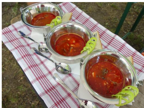
Tálalva a szegedi halászlé

A szakmai napot halételek főzőversenye, sétahajózás, motorcsónakázás tette még színesebbé.